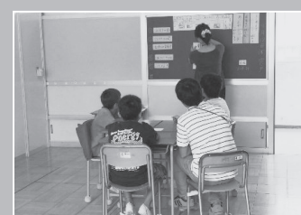
小集団指導の様子