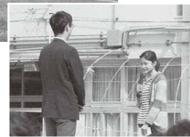
児童代表による宣誓

に協力しながら、「皆で楽しみ、皆で育てる芝生」を目指して取り組んでいきます。「問い合わせ」学校教育課