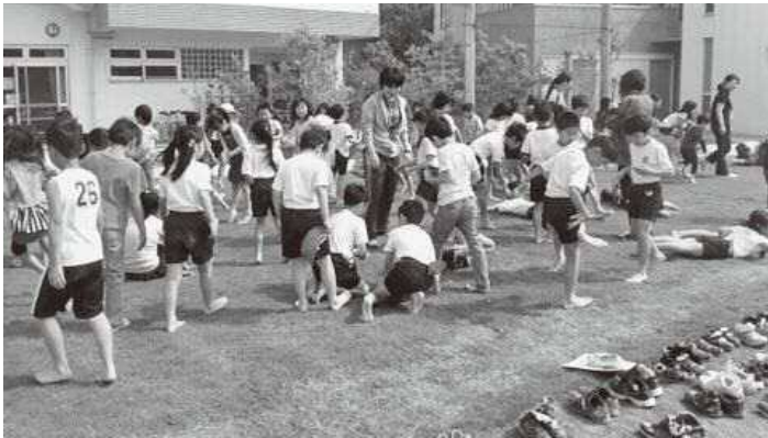
はだして芝生を楽しむ子どもたち