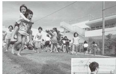
はだして芝生を楽しむ子どもたち