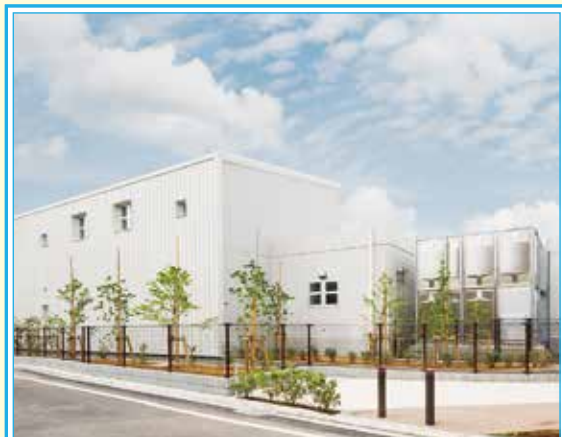
狛江市立中学校給食センター 案内図