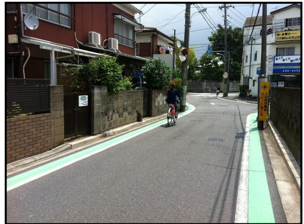
通学路上のグリーンベルト

なお、対策案の検討にあたっては、防犯、防災の観点についても留意することとします。