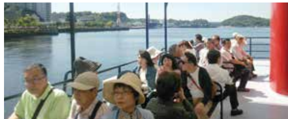
クルージング船上

次いで軍港見学へ。45分のクルージングは、ガイドの解説付きで、全長333mの米軍の原子力空母ロナルド・レーガンや海上自衛隊の艦艇を見学しました。ここは両国の海の護りの拠点で、ずらりと停泊する自衛艦も、掃海艇や事故にあった潜水艦を救助するものなど、その役割の多さにびっくり。「初めて知りました」などの声が寄せられました。