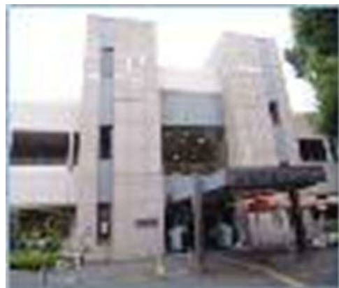
中央公民館（市民センター）