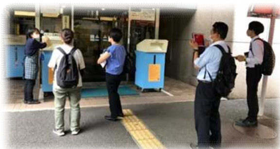
【写真↑】児童の来館は見合わせ、担当教員のみ見学を実施。教員が情報を持ち帰り、事前に図書館が配布した資料と併せて児童にレクチャーを行った。