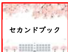
【セカンドブック見本図書】