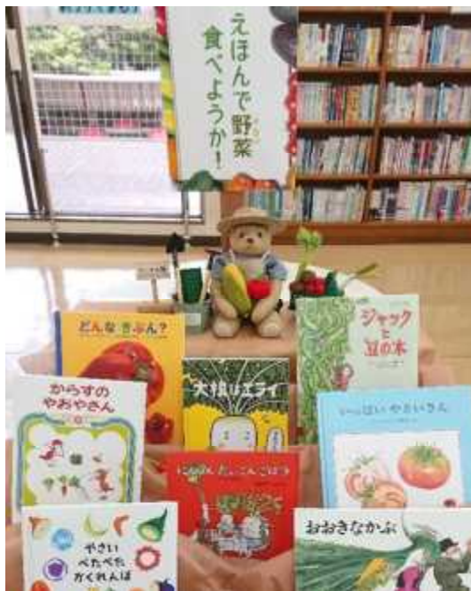
6月) えほんで野菜食べようか！