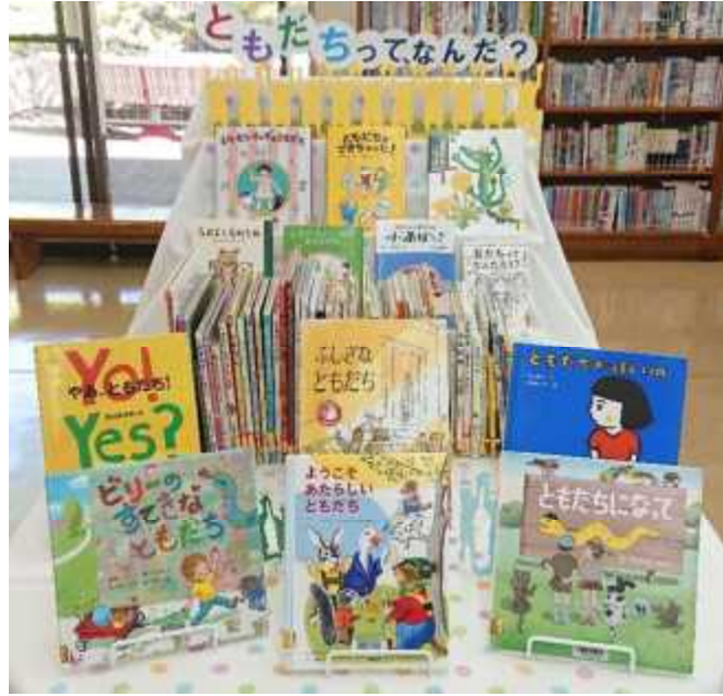
4月) ともだちってなんだ？