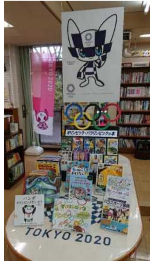
7月) オリンピック・パラリンピックの本