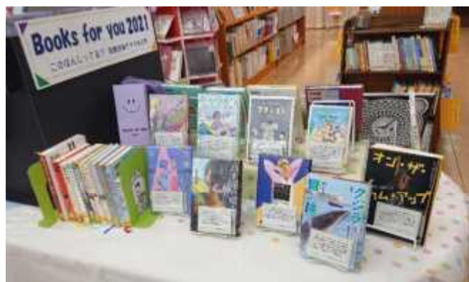
6月) Books for you 2021 図書館員がすすめる本