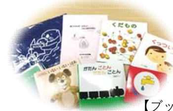
【ブックスタートパック】