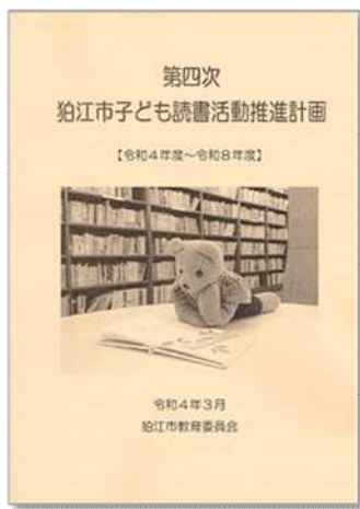
令和4年3月発行 (A4判無線綴じ 108頁 160円)

令和3年度は「第四次狛江市子ども読書活動推進計画」の策定に取り組みました。子どもの読書活動を推進するには、従前どおり、成長段階に合わせた取組を行っていくことが必要です。子どもに直接働きかける読書活動を継続していく上で、新しい生活様式に配慮しながら、関係部署と連携して子どもの読書環境や諸条件の整備に努めます。