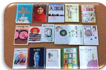
【サードブック対象本】