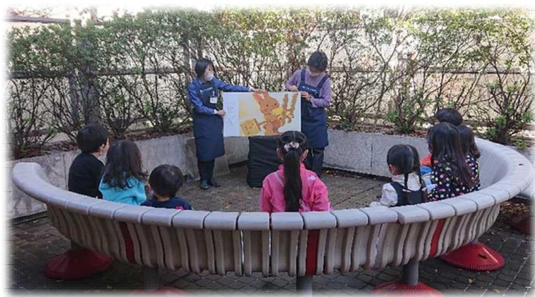
【屋外テラスで実施した「青空おはなし会」の様子】

子ども向けのおはなし会事業は、市内のおはなしグループや個人登録のおはなし会ボランティアの協力を得ながら、絵本の読み聞かせを中心に手遊び歌や折り紙工作などを交えたプログラムで行う定例会の他に、クリスマスなど季節のおはなし会や土曜日開催のおはなし会など、さまざまな機会をつくってきました。令和3年度は、定例会形式のおはなし会を見直した「えほんのじかん」を継続すると共に、屋外テラスで「青空おはなし会」を試行しました。